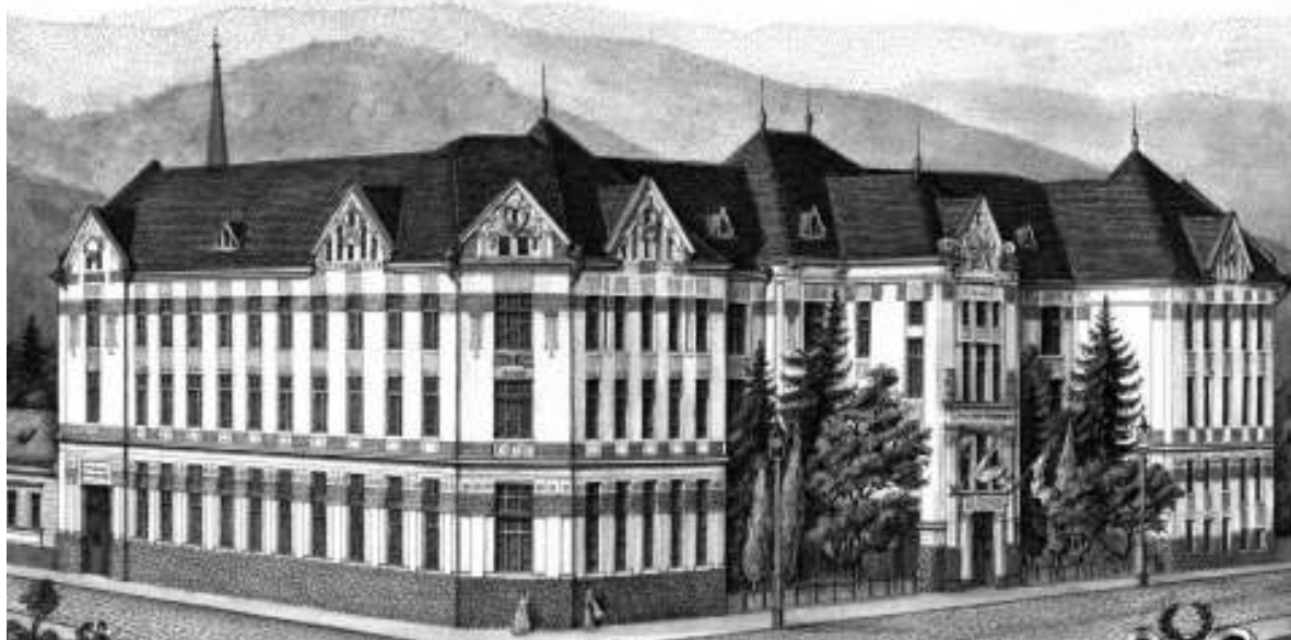
Liceul “Dragoș Vodă” din Sighetu Marmăției