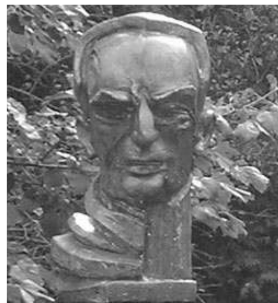
Vintilă Horia - bust realizat de Nicăpetre, "Rotonda scriitorilor români din exil", de la Câmpul Românesc, Hamilton, Canada

au fost practic comasate. Culpă a devenit cea de vinovat pentru „dezastrul țării prin comiterea de crime de război”, iar sfera de aplicabilitate extinsă la modul maxim posibil, prin luarea în colimator și a celor care s-au pus sub orice formă „în slujba hitlerismului”. Fapt care a permis condamnarea a numeroși intelectuali, scriitori, jurnaliști, a căror singură vină a fost atitudinea lor naționalistă și implicit anticomunistă, care i-a poziționat în tabăra antisovietică.