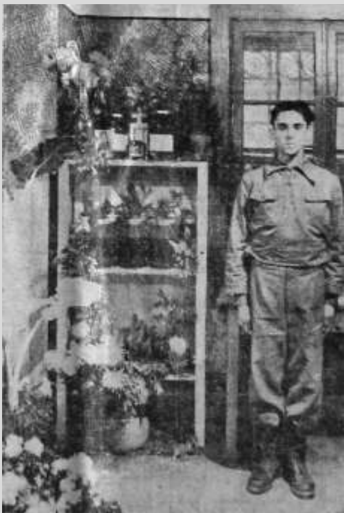
Urnele legionarilor uciși și arși la Crematoriu

La începutul lunii februarie 1939 este sunt arestați de Siguranța București legionarii Enache Nadoleanu, Ion Iovu și Martin Vucu suspectați că ar fi plănuit o tentativă de asasinat – nerealizată – asupra premierului Armand Călinescu. Potrivit notelor și rapoartelor făcute de agenții Prefecturii aflăm că atentatul ar fi trebuit să aibă loc în data de 5 februarie 1939, în timpul unei vizite oficiale a premierului la Chișinău – vizită ce nu a mai avut loc.