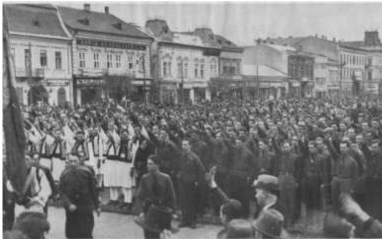
Publicul și studenții în fața Catedralei, în rugăciune

La scurtă vreme după finalizarea Congresului, în fața valului de aberații lansat de autorități la adresa studenților participanți (vezi în episodul anterior acuzațiile de profanare de la Sinaia, dezordinile invocate etc), Mișcarea Legionară răspunde prin publicarea unei broșuri cu titlul „Dezordinile” de la Târgu Mureș. Broșura, ce are 47 de pagini, conține un text semnat de Victor Puiu Gărcineanu (text pe care îl puteți citi în completarea serialului nostru) și 43 de fotografii din care rezultă impecabila organizare și ordinea desăvârșită în cadrul Congresului. Parte din acele imagini le-ați putut vedea în numărul trecut al revistei noastre, parte le vedeți acum. Broșura se încheie cu următoarele rânduri: Iată care au fost „dezordinile” de la Târgu Mureș. „Dezordini” inventate cu o caracteristică rea credință și răspândită de presa iudeo-comunistă a Sărindarului, cum și de anumite oficine deopotrivă vrăjmașe gândului și faptei noastre. Opinia publică creștinească și românească are a judeca! Apariția și distribuția revistei arată încă o dată faptul că atât Corneliu Zelea Codreanu, cât și Mișcarea Legionară a aprobat și a susținut toate cele întâmplate și hotărâte la Congresul de la Târgu Mureș.