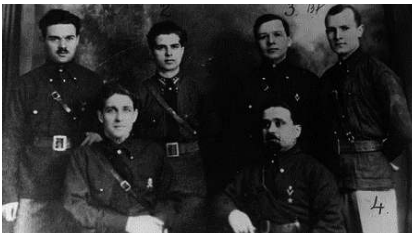
Căpitanul și Nicadorii în cămașă verde

Cuvântul, an XVII, serie nouă, nr. 54, 6 decembrie 1940