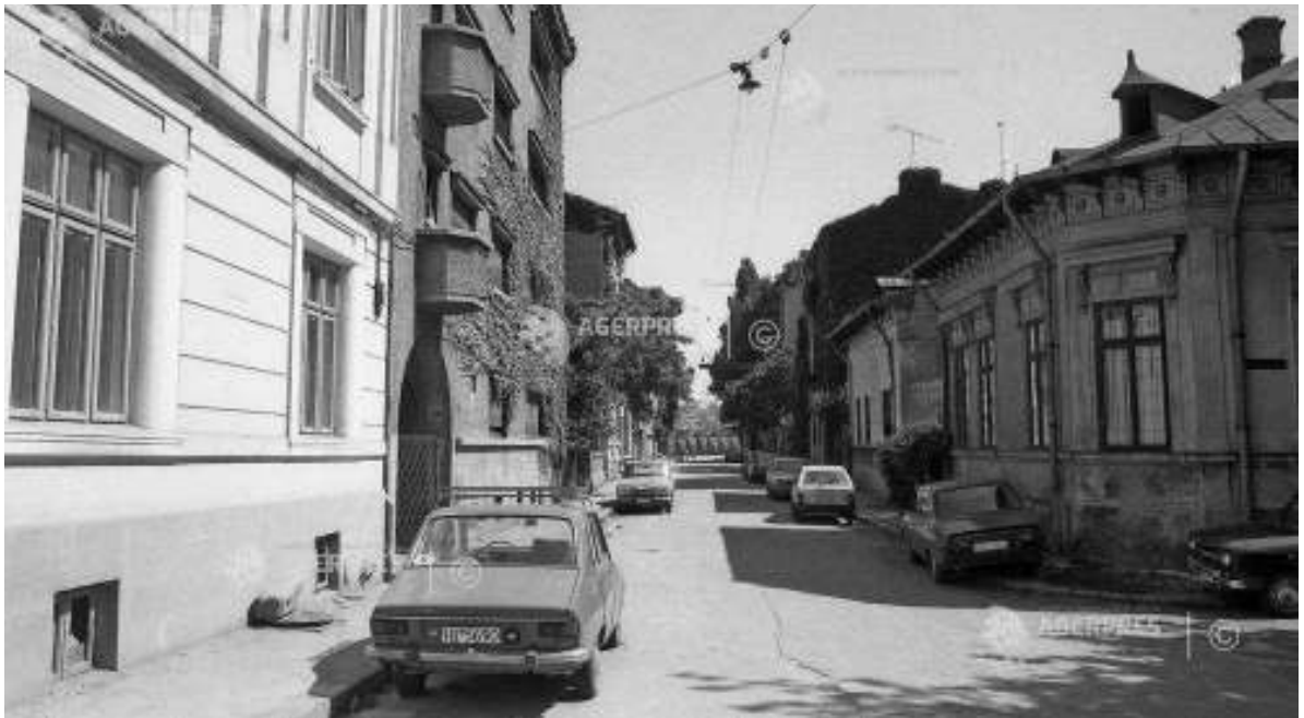
Str. Simonide 13, dreapta imaginii