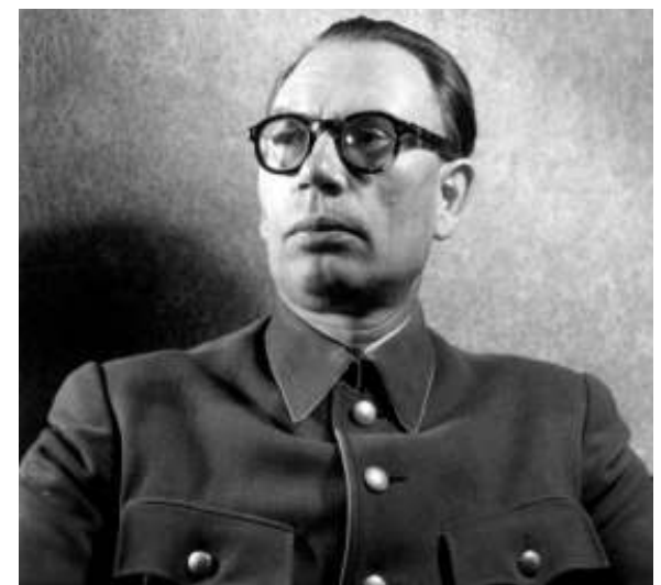
Gen. Andrei Vlasov

Sturdza înfierează însă și cinismul criminal, strigător la cer, al politicianilor anglo - americani, aliații bolșevicilor, care au predat sovieticilor