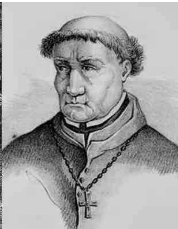
Figura legendară din capodopera dostoevskiană „Frații Karamazov” e mai actuală ca oricând. Chiar dacă nu o vedem (încă) întruchipată într-un personaj istoric real, duhul Marelui Inchizitor transpare din ce în ce mai apăsător din măsurile luate în ultimii ani de politicienii de pretudindeni, ghidonați parcă din umbră de aceiași păpușari care trag sforile la nivelul întregii planete.

Libertatea, care ar trebui să fie piatra de temelie a societăților autoconsiderate vreme de decenii întregi drept democratice, nu mai are același statut sacrosanct, de principiu fundamental. A devenit mai degrabă un element accesoriu, împins tot mai mult în plan secund, subordonat practic unor pretinse urgențe implacabile. Sau, în termeni marxști, libertatea a capitulat în fața „imperului necesității”. Deși țelul final al lui Marx era tocmai emanciparea de acesta din urmă, înțelegând în termeni economici, și edificarea unui „imperiu al libertății” ca paradigmă eshatologică. Numai că Marx nu a știut să-l definească precum a făcut-o un scriitor genial de inspirație creștină precum Dostoevski. Iar practicienii teoriei marxiste au ignorat complet ideea, rămânând robi eterni ai necesității economice, istorice, sau de orice natură, care nu se poate ridica deasupra orizontalei gândirii.